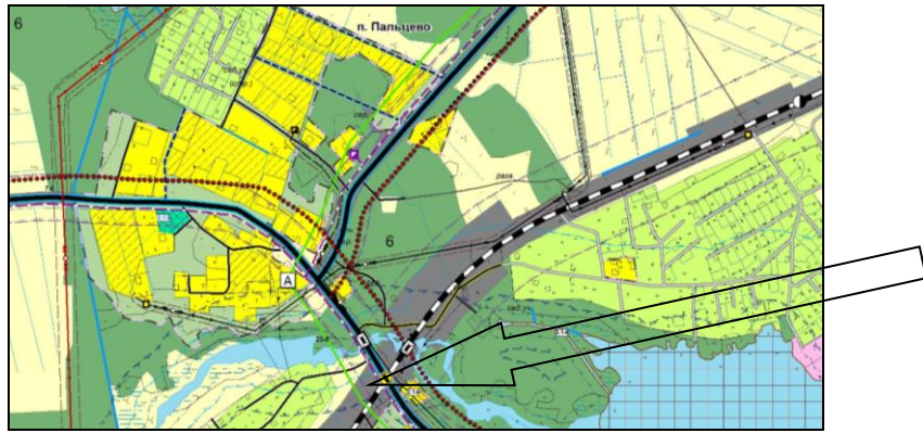
Рис. 3. Выкопировка с Карты функциональных зон